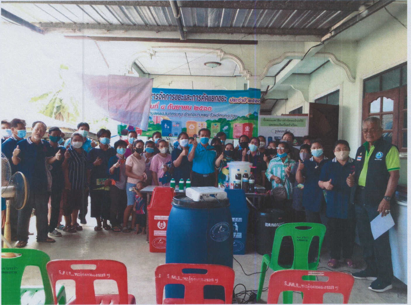
โครงการบริหารจัดการขยะและการคัดแยกขยะ ประจำปี ๒๕๖๓