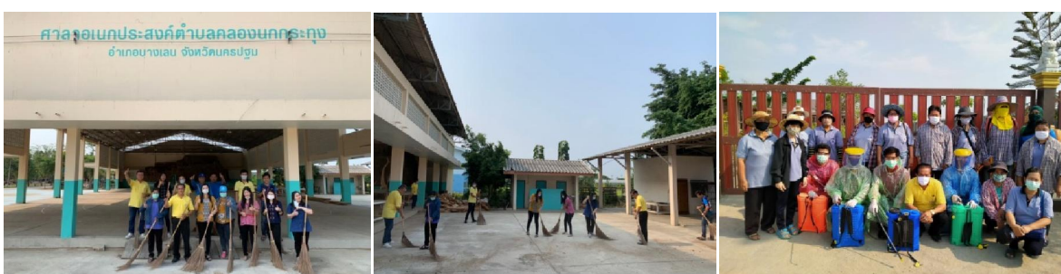
ศาลาเฉลิมพระเกียรติตำบลคลองนกกระทุง อำเภอบางเลน จังหวัดนครปฐม